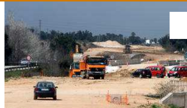
Foment reprèn les obres a la N-II