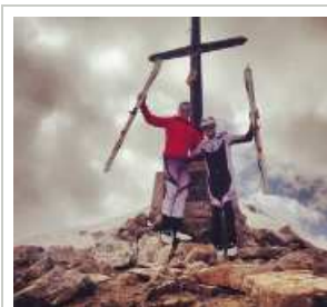
pinsach i Solà