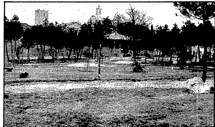
Parc infantil a Llagostera. — Amb la finalitat d'ampliar el parc infantil actualment existent, s'està procedint a la netja de la pineda del costat, que va ser cedida pels seus amos a l'Ajuntament. Els treballs ja estan força avançats.

MINISTERIO DE ECONOMIA Y HACIENDA. Le informaremos de un número de teléfono en cada Delegación de Hacienda, exclusivo para atender sus consultas relacionadas con el nuevo Procedimiento de Gestión Tributaria.