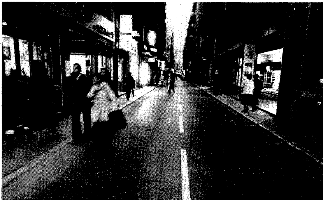
El carrer Nou de Girona és una de les zones comercials que es pot veure afectada per la mesura.

PUNT DIARI ha recollit opinions per tal de copsar la incidència que la mesura podria tenir entre nosaltres.