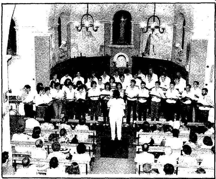
La coral Nit de Juny omplí l'església del barri.