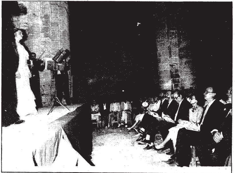
Un moment del concert inaugural del Vè Festival Internacional de Música de Vilabertran.