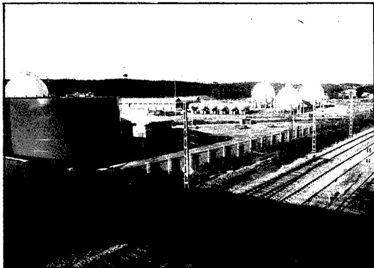
Els dipòsits de gas de la factoria de Caldes de Malavella, que podrien quedar inutilitzats si els treballadors anessin a la vaga

El comitè creu que, «cal negociar aquests possibles trasllats, però sense canviar la clàusula existent des de fa molt temps que estableix que no pot fer-se el trasllat, forçós d'un treballador