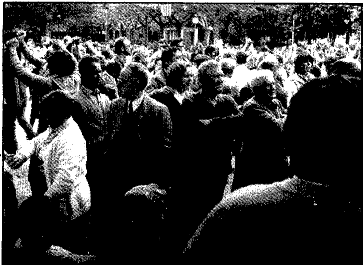
Els de Caldes volen homenatjar el mestre amb senzillesa