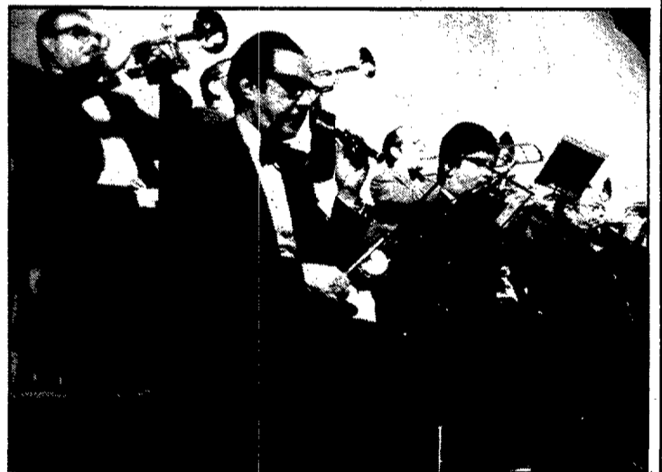
La Cobla Ciutat de Girona, una de les tres participants en l'aplec

C.G. = Ciutat de Girona; V.B. = Vila de Blanes; Me = Mediterrània (1) De l'Agrupació de Sardanistes de Caldes al seu Mestre (2) El poble de Caldes i el compositor Joaquim Soms a Francesc Mas i Ros (3) Finalista a la Sardana de l'Any