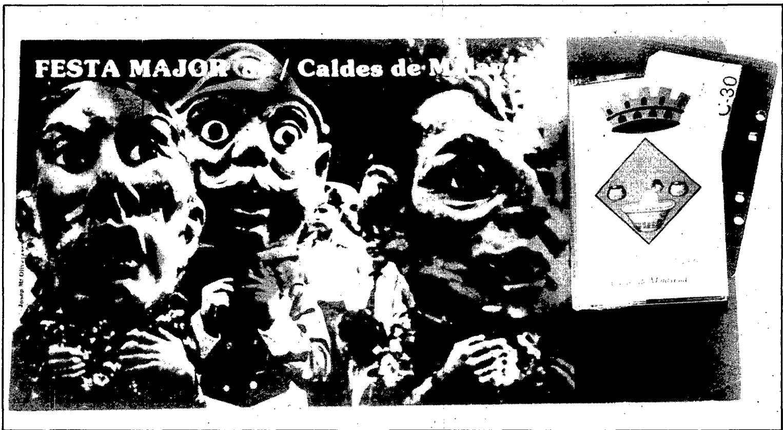
Caldes s'ha posat a l'avantguarda dels programes de Festa Major, tot enregistrant una cassette amb els actes que es faran

CALDES DE MALAVELLA. — «Sempre s'ha dit que a l'agost, bull el mar i bull el most. És, doncs, un mes que predisposa a l'ebullició, a l'efervescència, a l'agitació. Fins i tot les bombolles de la nostra aigua sembla que esclaten amb més força i trenquen l'eterna monotonia del rajar de les fonts». Així de poètic