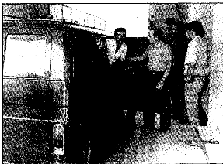
Tres membres de la banda han estat detinguts.

—Dimarts, 8 de juliol: Robatori de 40.000 pessetes, a punta de navalla, a dos alemanys que havien aparcat el cotxe prop de Sant Pere Pescador.