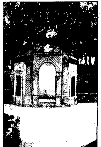
FONT DE LA VACA

A les 10 del vespre, a la plaça de Catalunya, audició de sardanes, per la cobla Vila de Blanes