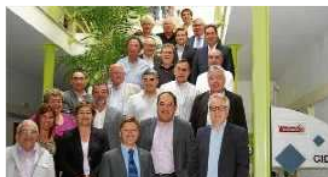
Els alcaldes de la Selva a Santa Coloma, on es va celebrar el consell.