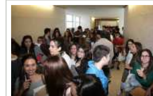
Alumnes de selectivitat, ahir a primera hora, abans d'entrar a les aules, a la Facultat de Dret de la UdG Foto: JOAN SABATER.