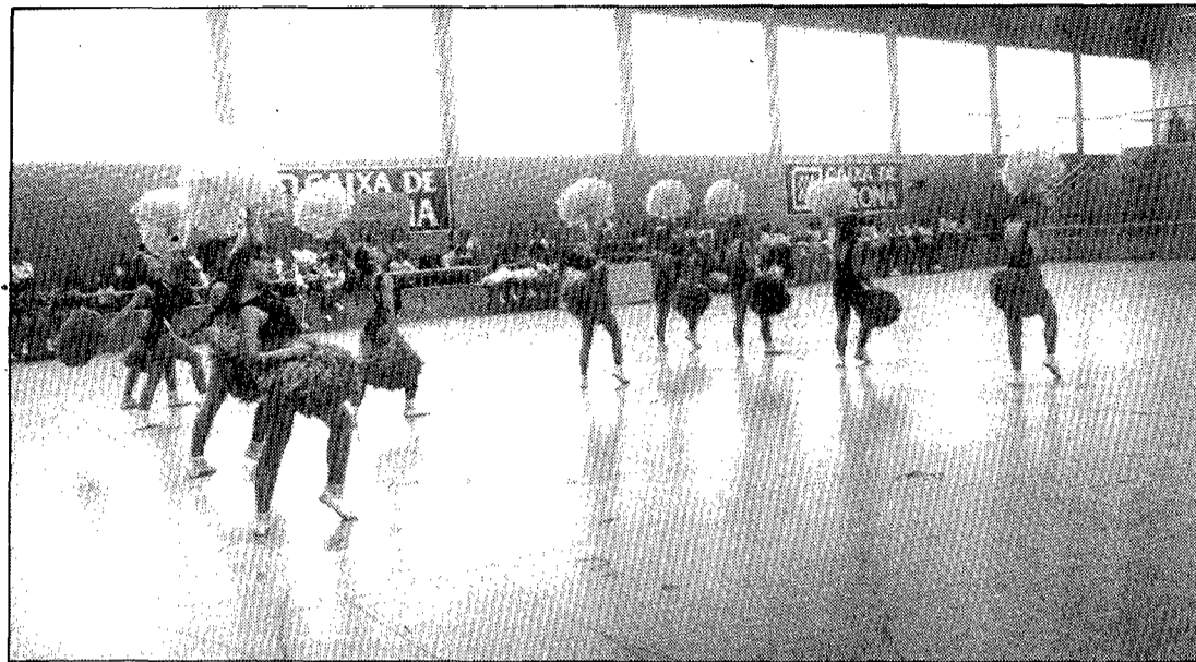
El club de Blanes ha guanyat els quatre campionats estatals de twirling.

són tres: el sol amb un bastó, el sol amb dos bastons i les actuacions en grup. El grup blanenc ha guanyat els quatre campionats estatals que s'han fet fins ara i set dels nou campionats de Catalunya.