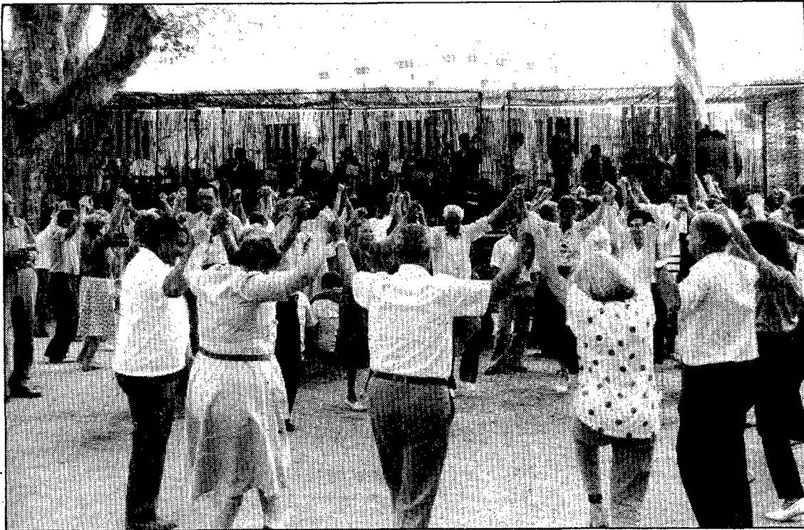
Fer-se soci de l'agrupació sardanista és rendible per a la gent de Caldes.