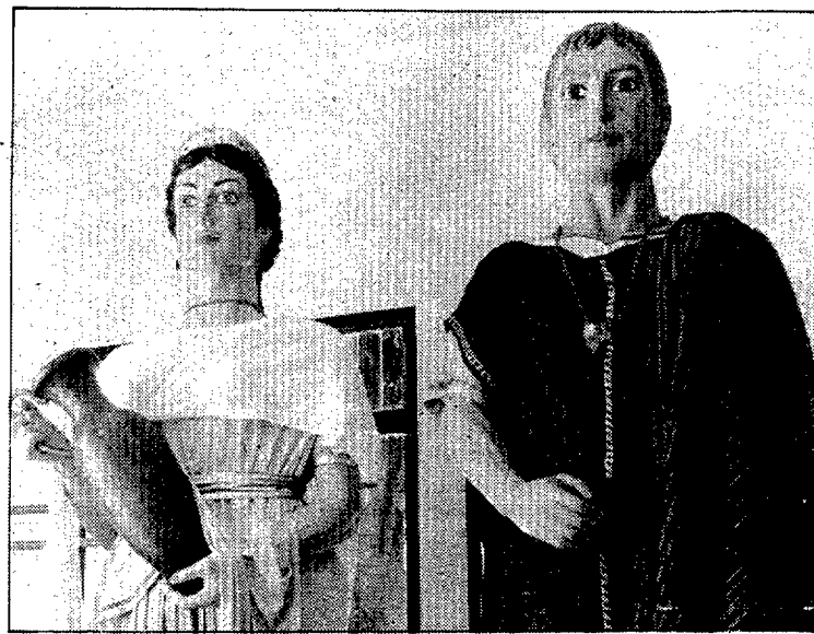
Els nous gegants pesen tan sols uns 35 quilos.

tècnics ja havien estudiat aquesta darrera possibilitat, però resultà inviable; l'última cosa sobre la qual s'especulava conservar eren els ulls de vidre de la geganta i les teles, que són de bona qualitat, tot i que el pes d'aquestes resulta excessiu. Al final s'optà per la solució fàcil i se'n feren construir uns de nous per una parella d'Arenys, amb fibra de vidre. Els joves del poble podran dur sobre les espatlles amb més facilitat els 35 quilos que pesa cadascun d'ells. L'acte de presentació serà demà dissabte abans del pregó, tot i que per al bateig oficial se'ls ha preparat una trobada de gegants per la diada de l'11 de setembre pròxim.