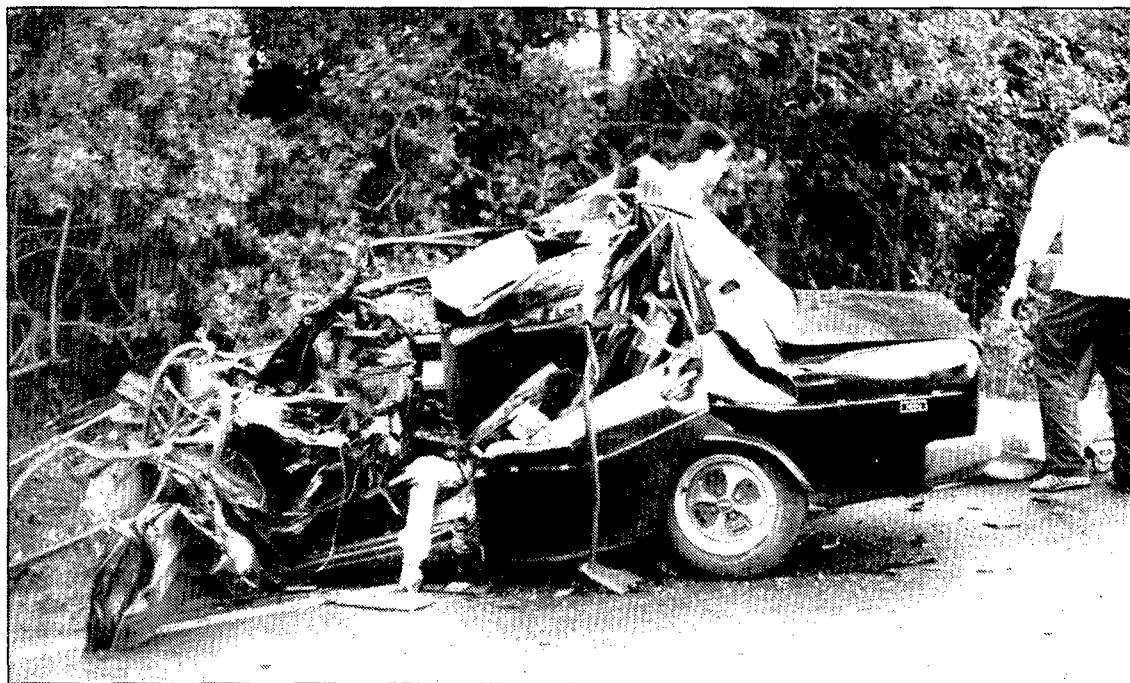
A la foto es veu l'estat en què va quedar el Seat-131 que va topat amb un camió a Ruplà.

Unes hores més tard els bombers van haver de treure del vehicle dos