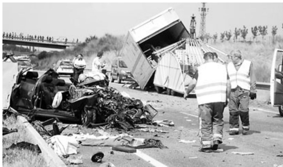
L'accident de trànsit mortal va passar a la una del migdia, a la carretera C-65.

D'altra banda, a Cadaqués, els Mossos van detenir dimarts a la matinada un motorista que conduïa pel carrer Riba des Poal i que va perdre el control del vehicle i tant ell com la