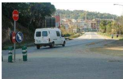
El principi de la carretera de connecta Llagostera -a la sortida d'aquest municipi- amb Tossa de Mar. diari de girona

La licitació de tots aquests projectes es va publicar ahir al Diari Oficial de la Generalitat de Catalunya.