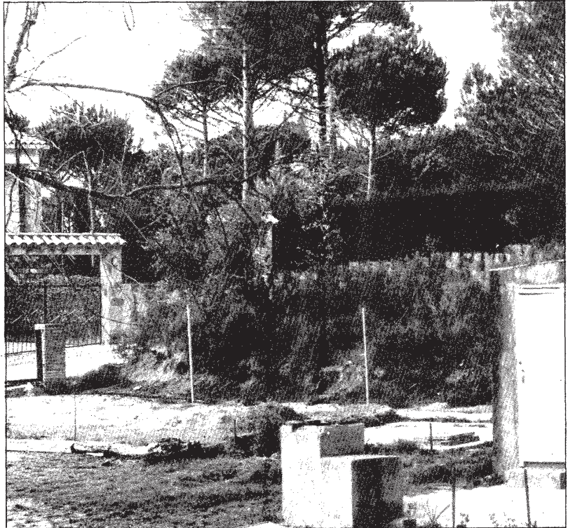
Les construccions que es van fer a les urbanitzacions promogudes a finals dels seixanta i principi dels setanta són, en la seva majoria, barraques o obres de poca qualitat. A la fotografia, les construccions de Llac del Cigne de Caldes de Malavella.

Les campanyes de promoció muntades a l'entorn d'aquestes operacions eren dignes del millor estudi de marketing. Gran quantitat de prospectes omplien diàriament les bústies oferint la possibilitat de fer una excursió de diumenge sense pagar res i amb la promesa, a més, de rebre un obsequi sorpresa com a agraïment a la resposta a la convocatòria. La gent s'hi apuntava en massa: famílies senceres, veïns. Sortien diumenge de bon matí en un autocar amb destinació desconeguda. Pel camí, un bon esmorzar i uns quants tocs propiciaven que els excursionistes arribessin al paratge amb molta alegria al cos i ben predisposats al que els proposessin. Un cop a la muntanya,