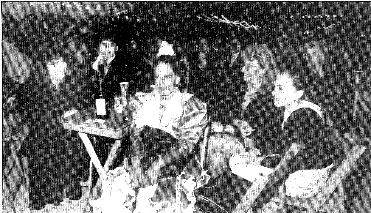
Durant els quatre dies de la Feria, s'hi van poder veure tota mena de vestits folklòrics.