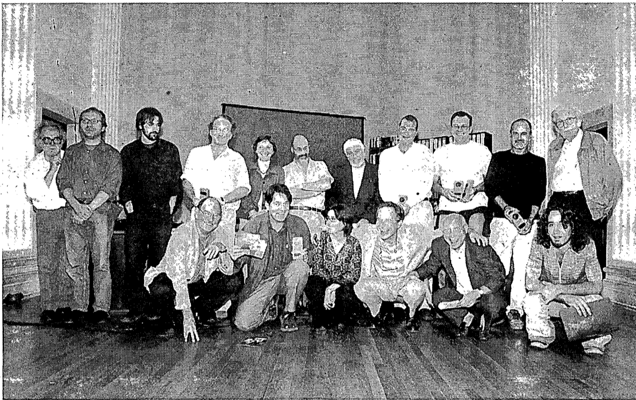
Tots els guardonats i els membres del jurat de la tretzena edició del Festival de Cinema de Girona.