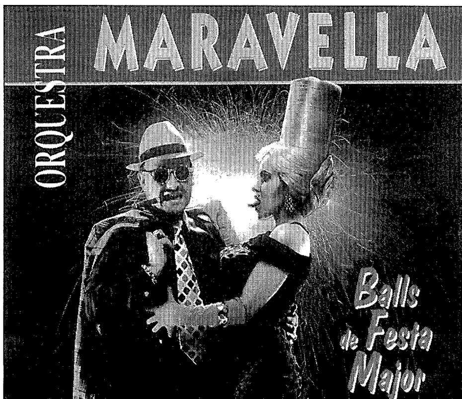
La portada del disc compacte.

Balls de festa major serà presentat per a tot l'Estat Espanyol el 9 d'agost vinent, per mitjà de l'emissió del programa de la primera cadena de TVE Noches de Gala . El nou disc de la Maravella és la primera pro-