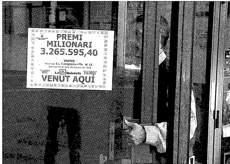
Un client entrant ahir a la tarda a l'administració de loteria que va segellar la travessa guanyadora.