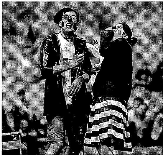
Els dos simpàtics pallsos que van oferir ahir el pregó de la festa major. / MIKEL LABURU.

tèntica selva on només sobreviu el més fort. Això justifica en part l'èxit del II Fòrum Empresarial, que va tenir lloc ahir durant tot el dia a la Politècnica, com una autèntica fira organitzada pels estudiants de les enginyeries industrials per entrar en contacte amb grans empreses que, en els seus estands, els oferien informació, caramels, gorres i altres objectes promocionals —també io-ios!!!—, i a alguns fins i tot un possible lloc de treball.