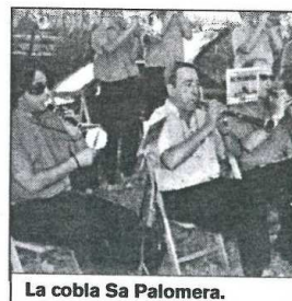
La cobla Sa Palomera.

La cobla Sa Palomera de Blanes actua aquest cap de setmana a Mallorca