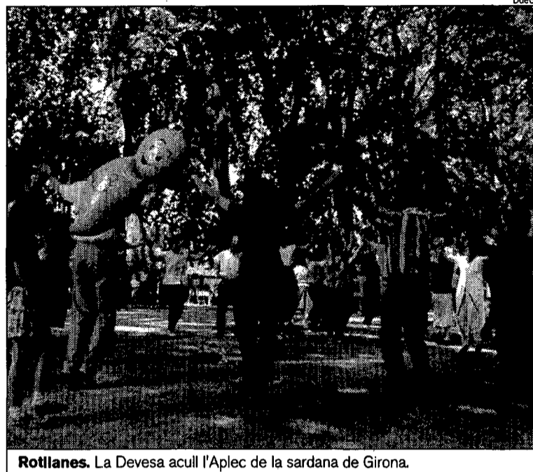
Rotllanes. La Devesa acull l'Aplec de la sardana de Girona.

sardana a l'escola seran les mateixes de l'aplec: Ciutat de Girona, Foment de la Sardana i Baix Empordà.