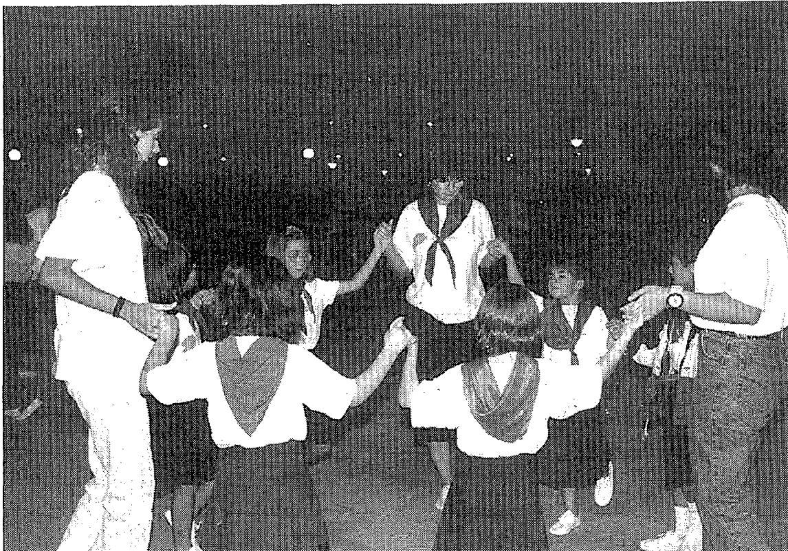
Un grup de nenes que van participar en els actes del Memorial.

La festa de dissabte a Sils va coincidir amb la cloenda del curset de sardanes que s'ha fet aquest estiu, així com de l'escola de danses catalanes. Els infants participants en el curset van fer el Galop d'entrada, a més de participar juntament