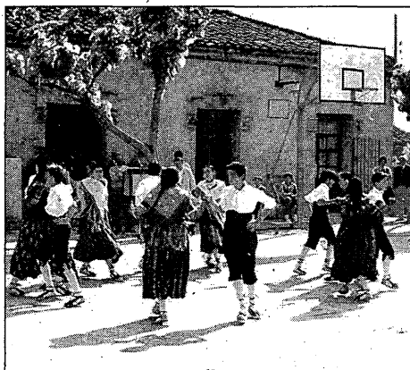
L'esbart del Montgrí, ballant davant l'escola.

flors. La segona gran secció de l'exposició estava instal·lada, com cada any, al pati interior del complex cultural, i així es va deixar lliure de flors el passadís. A banda de l'oferta floral, el visitant inquiet va poder veure la nova sala museu dedicada al pintor guixolenc Josep Albertí i una exposició de fotografies sobre un viatge al Nepal, obra del fotògraf Jordi Gallego. A més, a la planta baixa, el Museu d'Història de la Ciutat oferia l'oportunitat de fer un repàs dels principals moments de la vida de Sant Feliu.