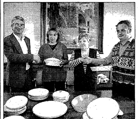
Un moment de l'entrega del premi.