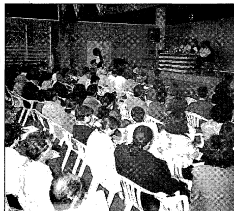
La jornada es va celebrar al mateix institut de Cassà.

tiv— la tardor passada, a causa dels aiguats que van caure. Per celebrar el nou nom, els quinze nens de l'escola, que és unitària, les dues mestres i la resta del poble van fer una jornada de portes obertes al centre, i tot seguit va actuar l'esbart dansaire del Montgrí.