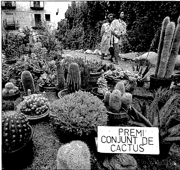
Un treball guanyador d'un dels premis del concurs.