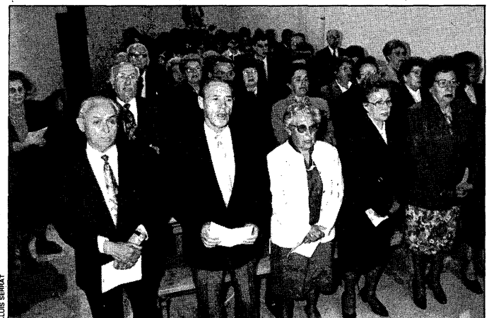
Un grup de jubilats durant la cerimònia que es va celebrar al matí.

només els alumnes del curset, mentre que les altres tres també les podia ballar el públic en general. Fonts de l'agrupació van assegurar que hi havia més públic que altres anys. Els alumnes van ser obsequiats amb un pin de l'Agrupació de Sardanistes. /JAUME GINESTA