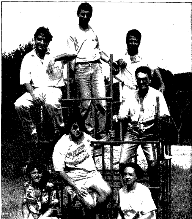
Alguns dels membres de l'Agrupació Sardanista que han organitzat la major part dels actes de la festa.