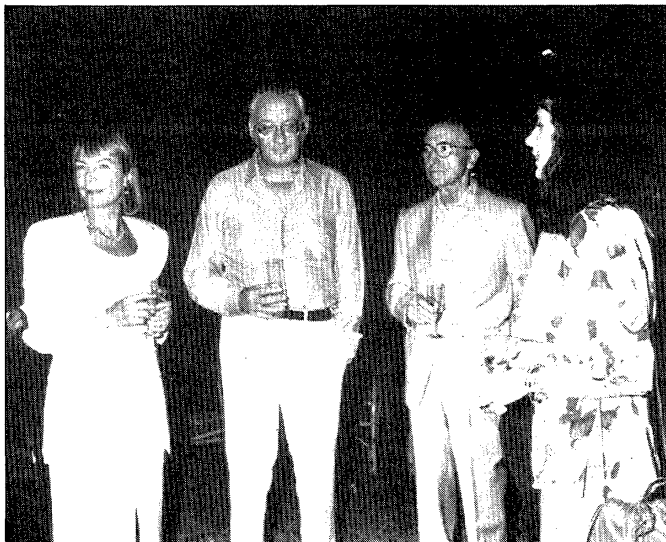
L'ex-president del Senat, José Federico de Carvajal, amb Elena Boira.