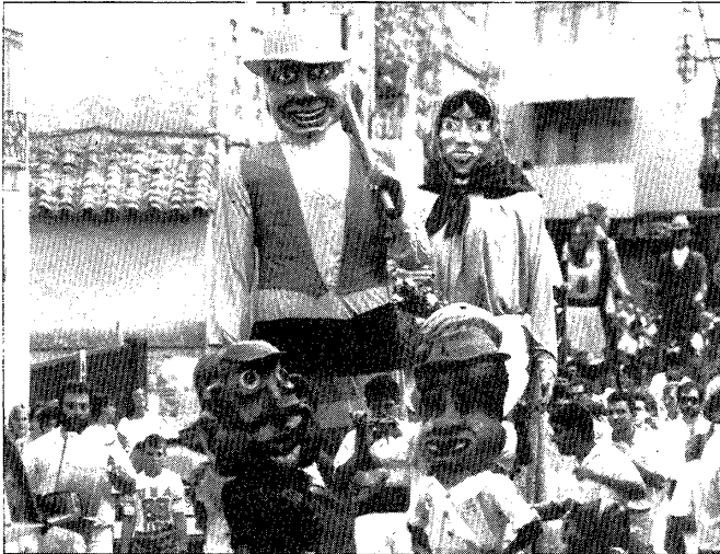
Un moment de la cercavila que van fer les colles de geganters.