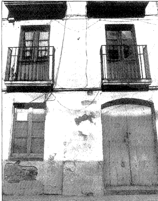
La caserna de Llançà, abandonada pels guàrdies.

Segons Navarro, abans d'acabar l'any també s'adjudicaran les obres de construcció de la caserna de Banyoles.