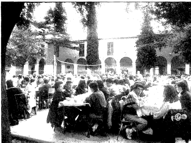
Els alumnes i professors van fer un dinar al claustre de l'institut Ramon Muntaner.