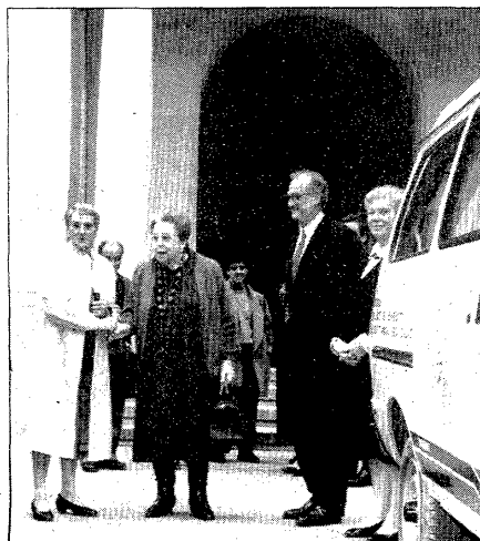
El moment de l'entrega de la furgoneta als responsables de la protectora d'animals i plantes de Figueres.