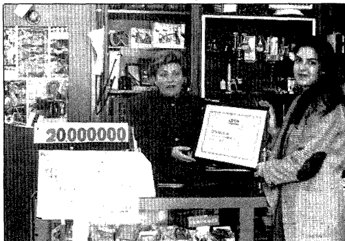
La representant de LOTO CATALUNYA entrega el certificat del premi al propietari de l'establiment.

En el sorteig del Súper 10 del dimarts dia 9 d'abril de 1991 va sortir un sol encertant, que ha guanyat 20.000.000 de pessetes. Havia jugat 100 pessetes a l'aposta de 10 números, i els va encertar tots 10.