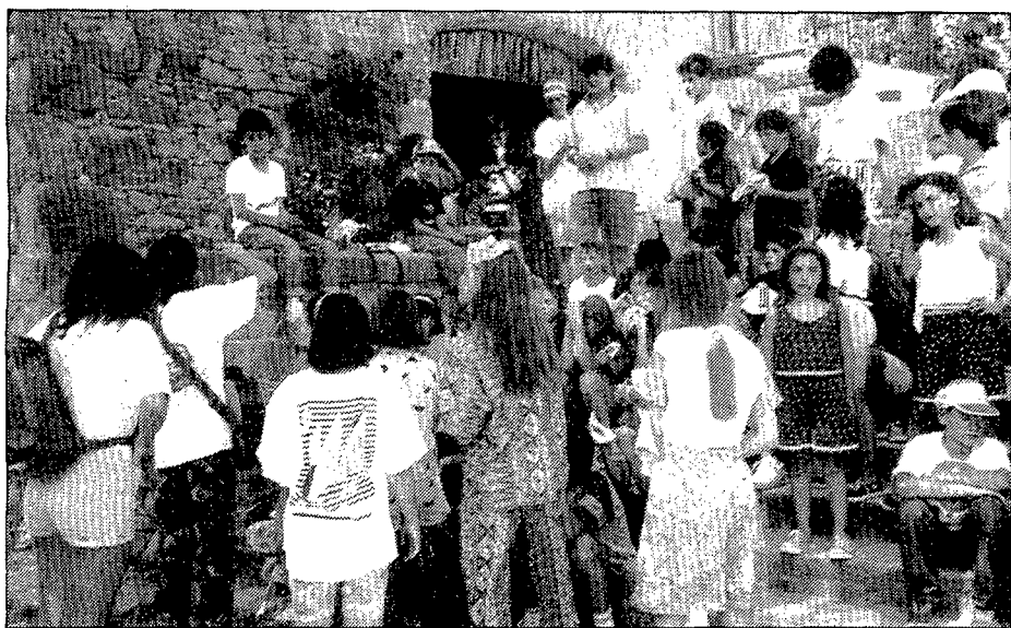
A la fotografia, alguns dels participants a les colònies.

■ Parlavà. — Amb un ofici solemne acompanyat per orquestra començarà avui la Festa Major de Parlavà, que s'acabarà dissabte amb un ball de fi de festa a càrrec del grup Ébano. En el ball d'aquesta nit tocarà l'Orquestra Maravell i divendres, el grup Cimarron. / EL PUNT