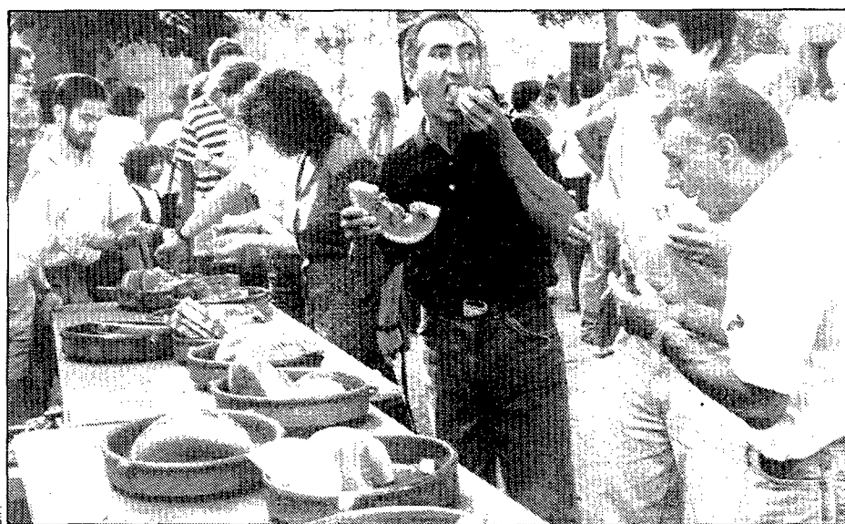
La fotografia recull un moment de la tornaboda.