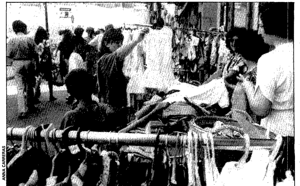
Els vianants van poder passejar i remenar els articles de les parades.

recorregut més curt, ja que van anar de l'espigó del port fins a la platja. La resta de participants van creuar tota la badia, que fa uns 300 metres. Al final de la prova, va haver-hi el repartiment dels premis als primers classificats de cada categoria.