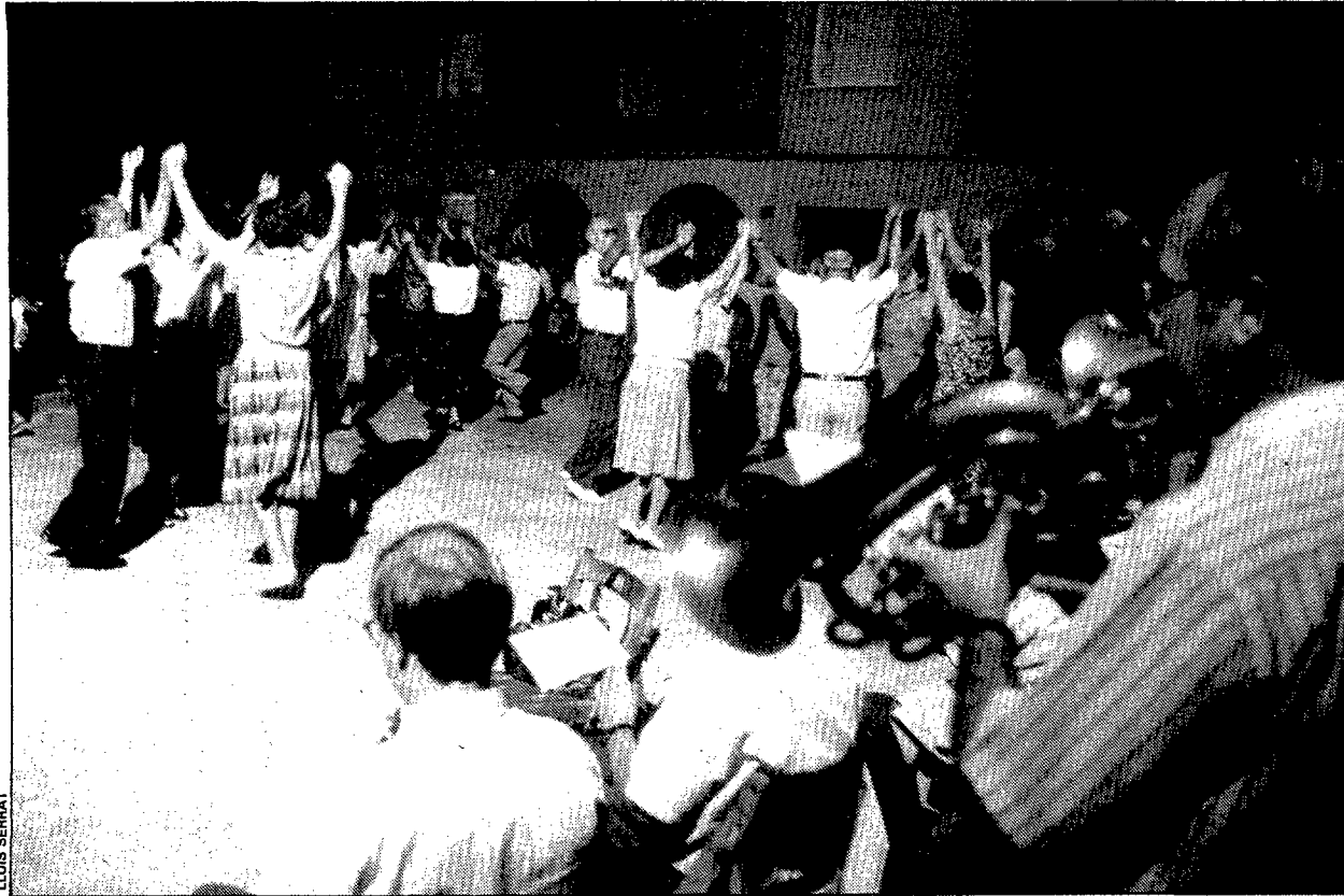
A la foto, un moment de l'audició de sardanes.

■ Olot. — El grup d'esplai olotí Gamossinos, amb seu social al barri de la Caixa de la ciutat, celebrarà aquest dissabte vinent el desè aniversari de la seva fundació, l'any 1981. El grup ha programat un seguit d'actes per commemorar la diada, el primer dels quals, un concurs de dibuix, començarà el mateix dissabte a dos quarts d'onze del matí. El tema d'inspiració del concurs, obert a totes les edats, seran els mateixos Gamossinos. A la tarda, es projectarà un àudio-visual i s'inaugurarà una exposició fotogràfica als locals del centre. El jornada es clourà amb un sopar popular de pa amb tomata i embotit i amb un ball. / S.A.