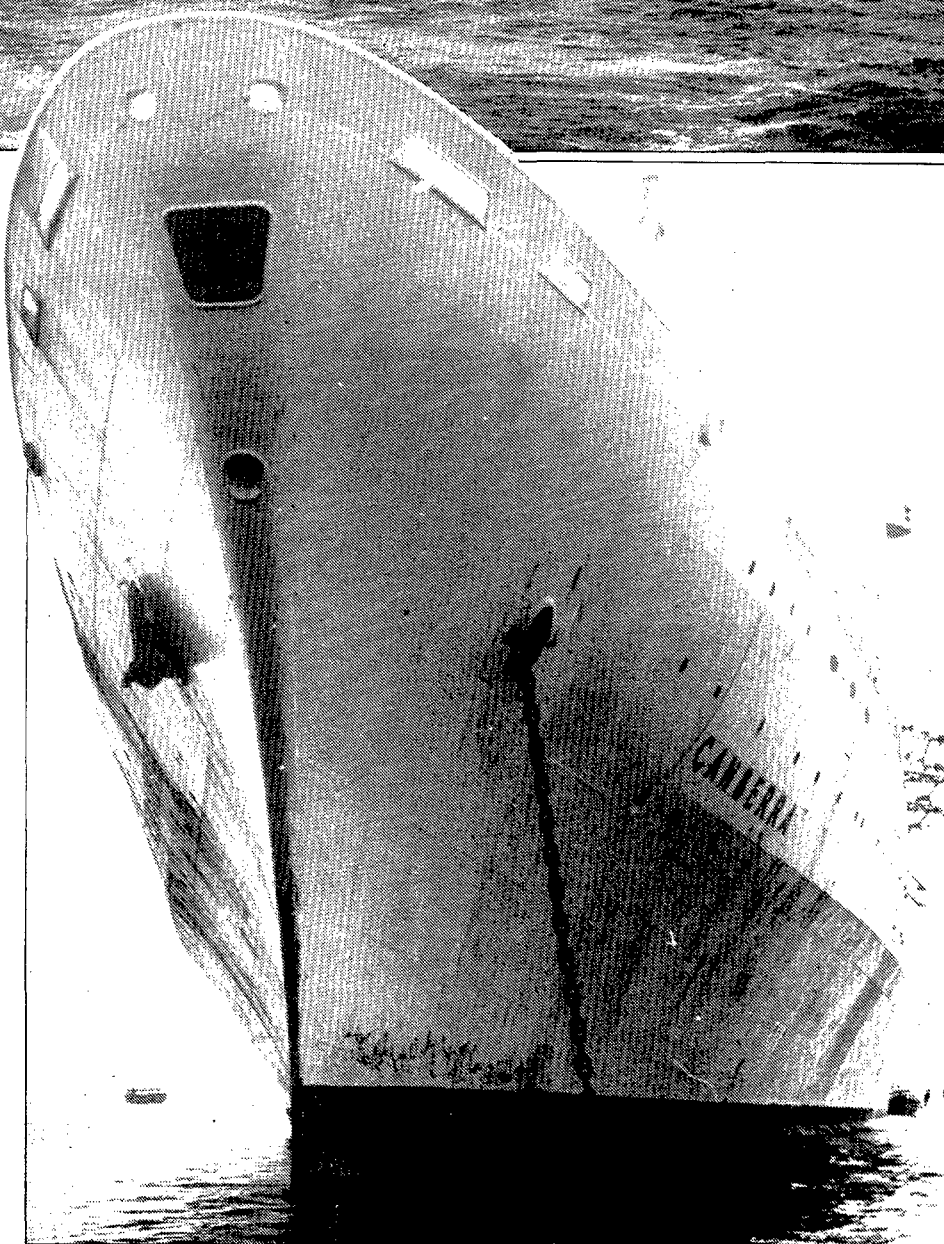
A dalt, el Canberra, fotografiat quan va ancorar a la badia de Palamós el mes de setembre de 1980. A baix, la proa del vaixell, en el qual viatgen més de mil cinc-cents passatgers.

El Canberra, que romanirà a Palamós fins a les 6 de la tarda del mateix dia, està consignat a la Companyia Matas SA de Palamós, que portarà a terme totes les tasques de serveis a la nau. Aquesta és de nacionalitat anglesa i el seu nom és degut al fet que abans era dedicat al tràfic