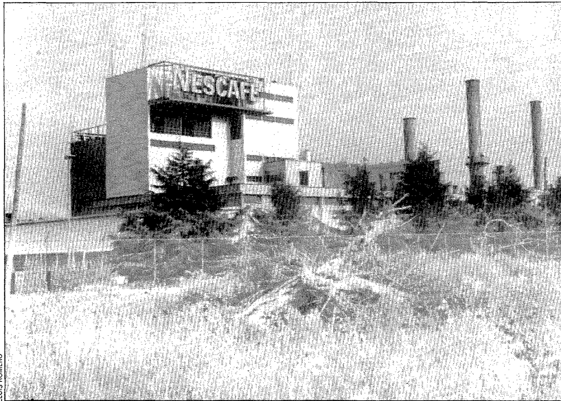
A la fotografia, la fàbrica Nescafé de la multinacional a Girona, vista per la banda on transcorre el riu Ter.

Un cop feta pública la sentència del Tribunal Superior, la conselleria i l'Ajuntament de Girona van apellar davant el Suprem. «Passat un temps —van informar fonts de la delegació de Govern a Girona— els recurrents se'n van desdir