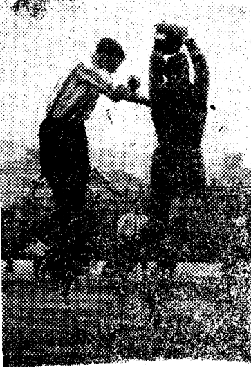
Un magnífico bloqueo