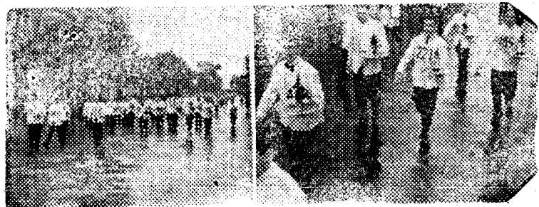
Los aspectos de la carrera de marcha para Camareros, celebrada el pasado domingo en Barcelona