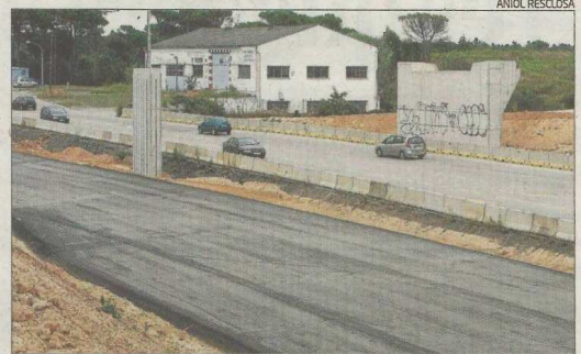
La Nacional-II serà l'única inversió destacada per l'any vinent.

invertir 2,056 milions d'euros a la represa de les obres entre Maçanet i Sils. Un desdoblament, però, que només arribarà fins a l'enllaç amb la C-35, després que Foment tanqués definitivament la porta a estendre la futura autovia A-2 fins a