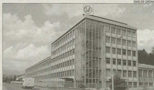
Fàbrica de Soler & Palau a Ripoll.

L'empresa alemanya contribuirà en més de 20 milions d'euros (els que va facturar l'any passat) a la xifra de negoci de S&P, que al 2013 podria arribar als 500 milions d'euros, van dir fonts de la companyia al diari Expansión . S&P, que l'any passat va comprar 4 empreses a Europa i Llatinoamèrica, compta amb 19 fàbriques en 12 països, i dóna feina a 3.600 empleats a tot el món.