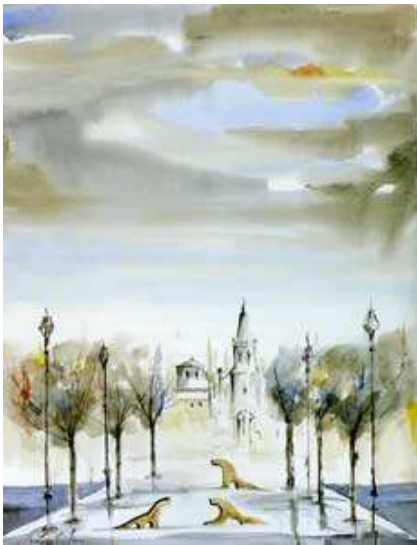
Plaça de la vila Aquarel·la 50x40 pintura basada en l'obra poètica de Salvador Sunyer i Aimeric Llibre de Coneixences

inici | col·lecció local | persones | mapa web