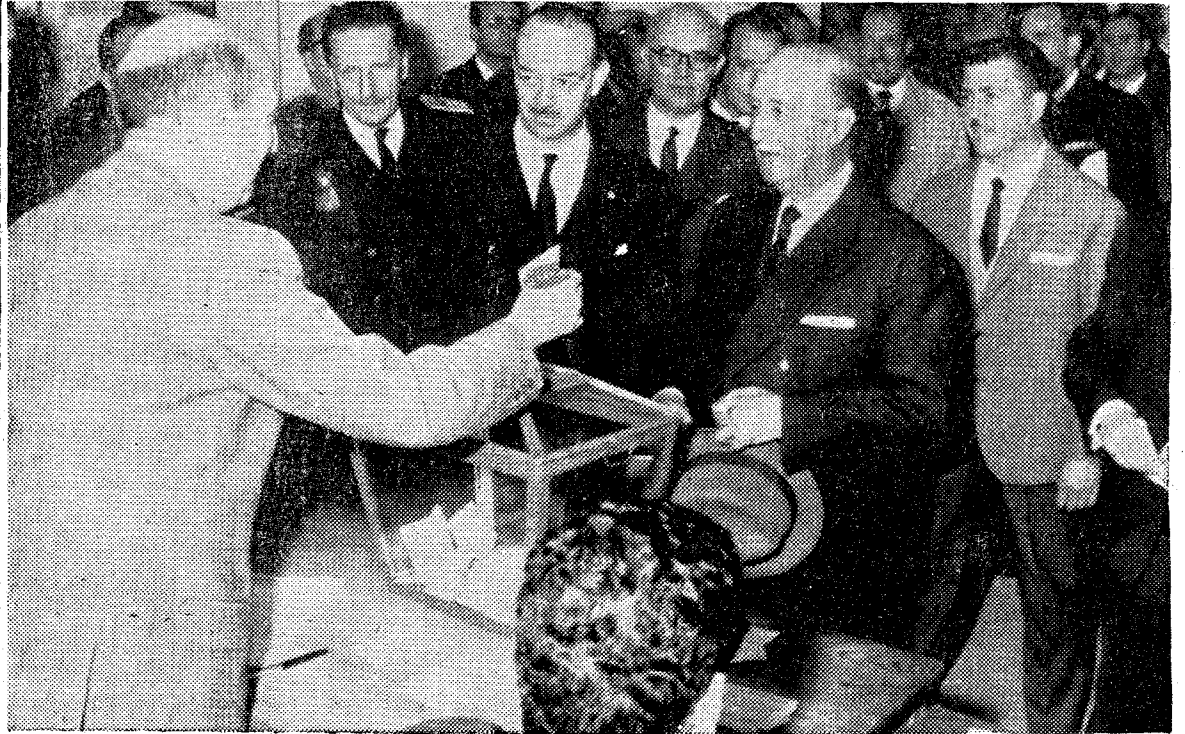
Madrid. — S. E. el Jefe del Estado, Generalísimo Franco, en el momento de depositar su voto en las elecciones municipales por el tercio de cabezas de familia. El Jefe del Estado acudió a un Colegio electoral instalado en una escuela nacional de El Pardo, correspondiente al distrito de Universidad.

Diario del Movimiento Depósito Legal - GE N.º 2 - 1953 Redacción y Administración: Gral. Primo de Rivera, 6, pral. Teléfonos 1882 y 2042 Martes, 5 de Noviembre de 1953