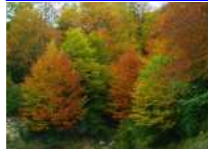
La tardor despunta al Ripollès