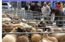
Fira de Santa Teresa de Ripoll