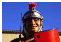
XX Caminada a la Via Romana