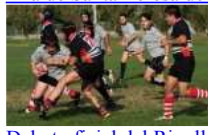
Debut oficial del Ripollès Rugby Club