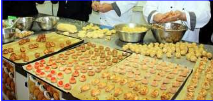
Tots Sants no és Tots Sants sense panellets/L.C.