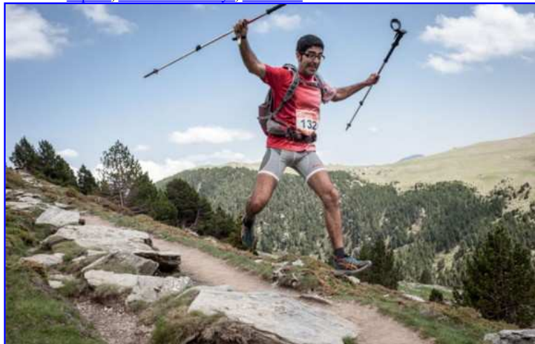
El Ripollès viu un autèntic falera per les curses de muntanya. Foto:

Arxivat a: Esports , curses de muntanya , Entrevalls