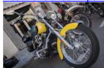
Trobada de motos Harley, custom i trike's a Ripoll