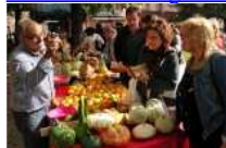
Fira de la Carbassa de Sant Joan de les Abadesses