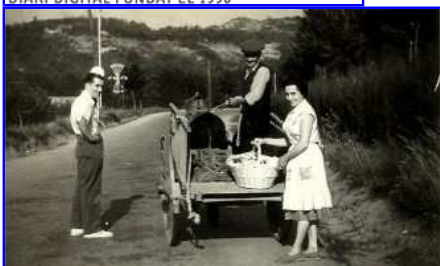
Un carboner de Borgonyà, durant la dictadura franquista