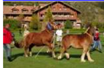
III Concurs Comarcal del Cavall Pirinenc