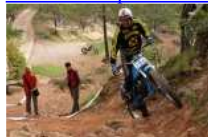
2 Dies Trial Santigosa Clàssic