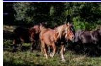
Tria dels Mulats d'Espinavell