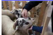
Fira de Santa Teresa de Ripoll (2)