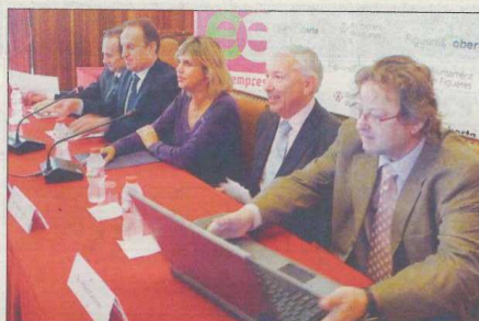
Reempresa es va presentar ahir a Figueres en presència dels representants del municipi, de la Diputació i de CECOT