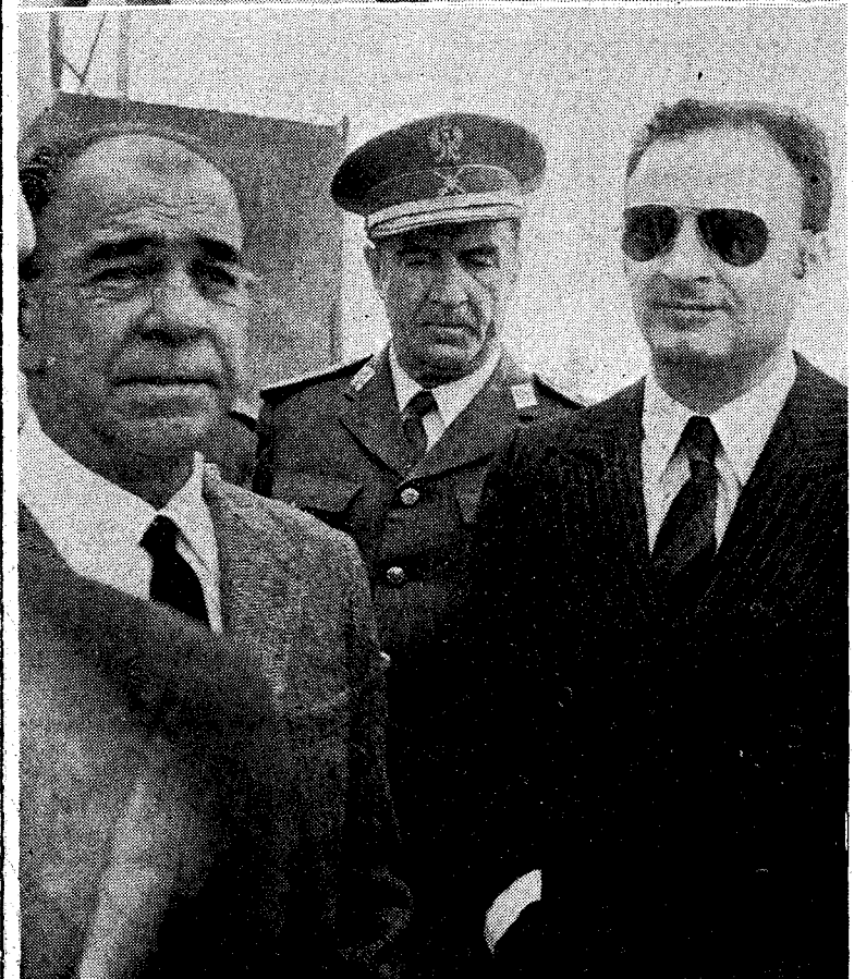
Dos momentos del recorrido del Ministro del Aire por las dependencias e instalaciones del aeropuerto Gerona-Costa Brava.