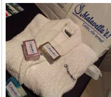
Alguns dels productes de la nova campanya "Malavella't", impulsada per l'Ajuntament de Caldes.